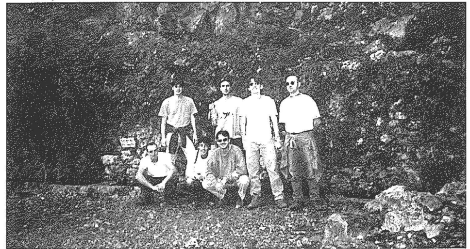
Membres del CEU a la Font del Burgar (Montsià)